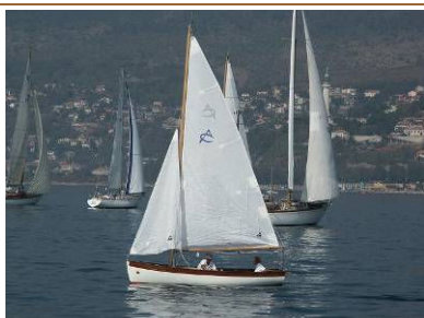
PANOLA (replica, 2002) Passera, progetto originario del 1947 di Artù Chiggiato