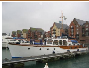
LA BELLE DAME (2007) Motoryacht, costruito nel 1967 su progetto di H. Desfy