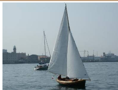
DESPINA, NABABBO, ISTRJA (2000) Passere lussiniane, progetto di Carlo Sciarrelli