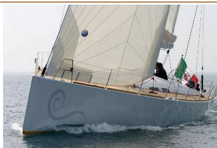
PENELOPE, SWING (2004) Sloop, progetto di Andrea Vallicelli