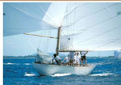
SYLPHIA III (1994) 8 m. S.L., costruita nel 1929 su progetto di Beltrami i