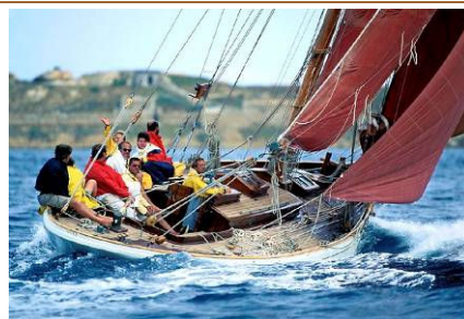
MOYA (1993) Cutter aurico, costruita nel 1910 su progetto di William Crossfield