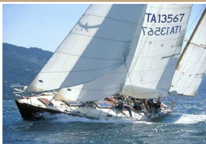
ISABELLA (1999) Yawl, progetto di Carlo Sciarrelli