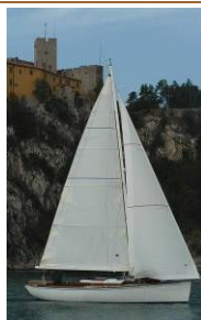
NOI (2006) Sloop, progetto di Lorenzo Bono