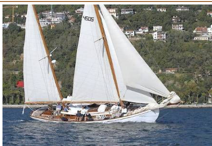
DELFINO (2006) Ketch, costruita nel 1942 su progetto probabilmente di J. G. Alden