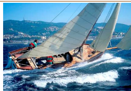
SORELLA (2002, 2007) Gaff cutter, costruita nel 1858 su progetto di Dan Hatcher