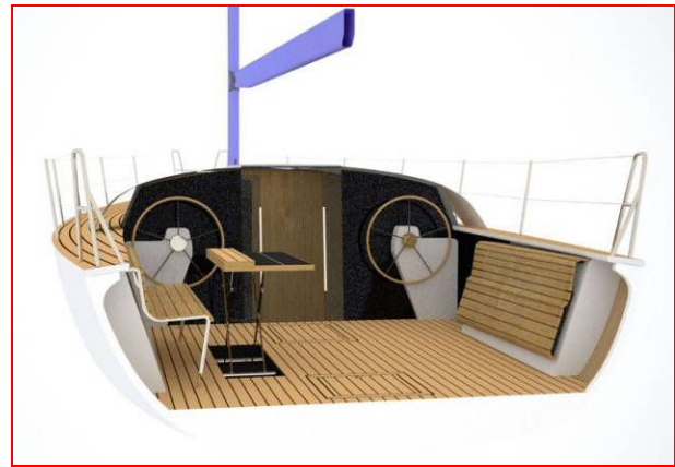
Rendering dell'imbarcazione: complessivo e particolare del pozzetto