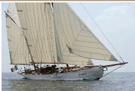
JAVELIN (2006) Ketch, costruita nel 1897 su progetto di Arthur Eduard Payne