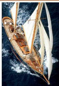
TIRRENTIA II (1992) Ketch aurico, costruita nel 1914 su progetto di Frederick Sheperd