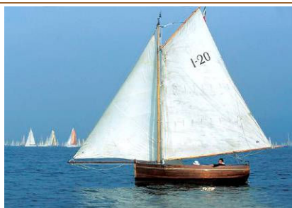
BAT (1999) Gaff cutter, costruita nel 1889 su progetto di C. P. Clayton