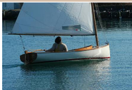
AMELIA (2005) Catboat, progetto di Federico Lenardon