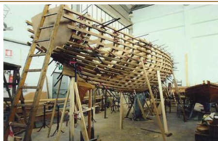
ORJON (2001) Cutter, progetto di Carlo Sciarrelli