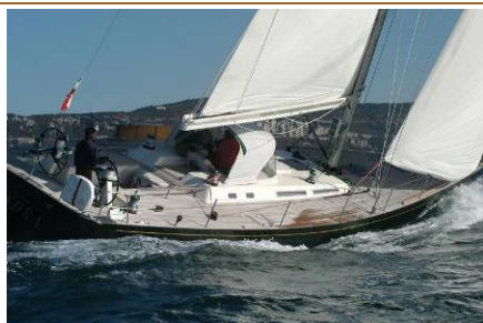
CHANDRA (2004) Sloop, progetto di German Frers