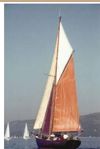
DYARCHY (1994) Gaff Cutter, costruita nel 1934 su progetto di Laurent Giles