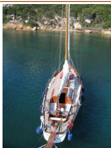
MIRIELLA (2004) Sloop, costruita nel 1972 su progetto di Peter Nicholson