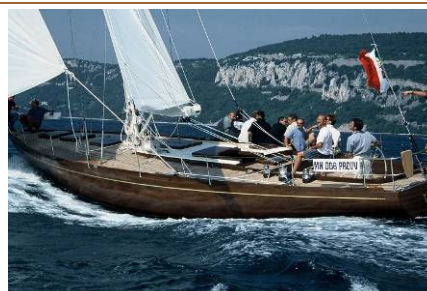
TIZIANA IV (2002) Sloop, progetto di Carlo Sciarrelli