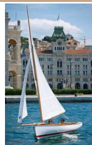
FEATHER 14' (2007) Catboat, progetto di Federico Lenardon